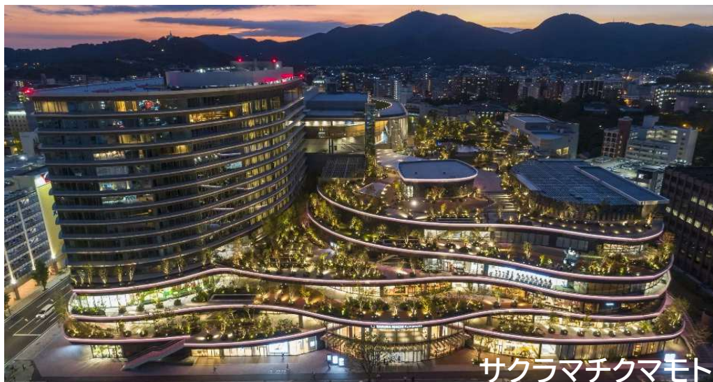
サクラマチクマモト